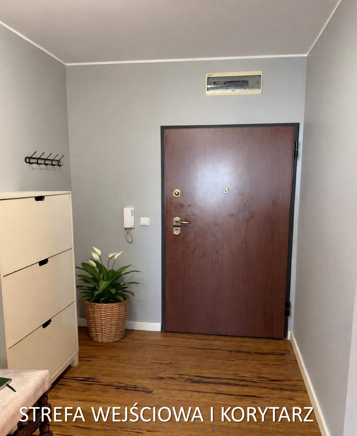
STREFA WEJŚCIOWA I KORYTARZ