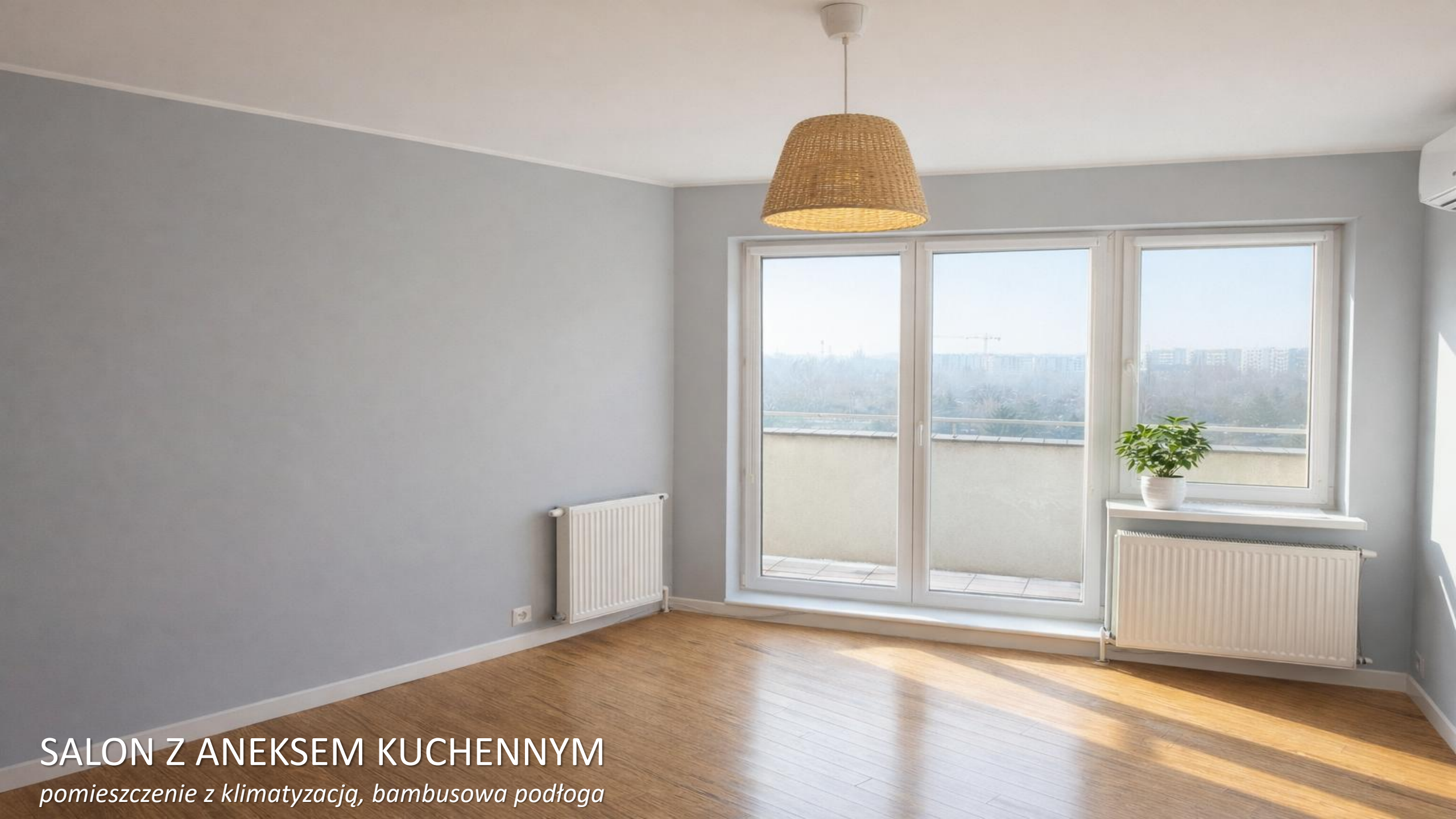
SALON Z ANEKSEM KUCHENNYM pomieszczenie z klimatyzacją, bambusowa podłoga