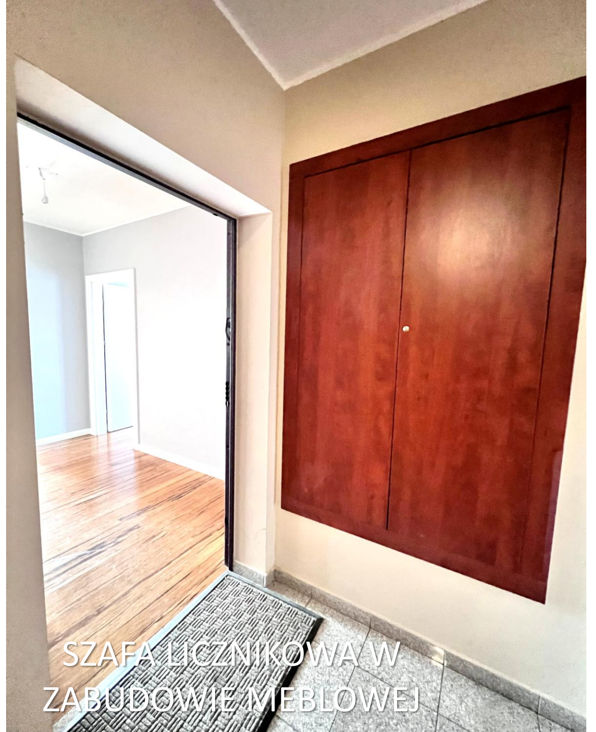
SZAFKA LICZNIKOWA W ZABUDOWIE MEBLOWEJ