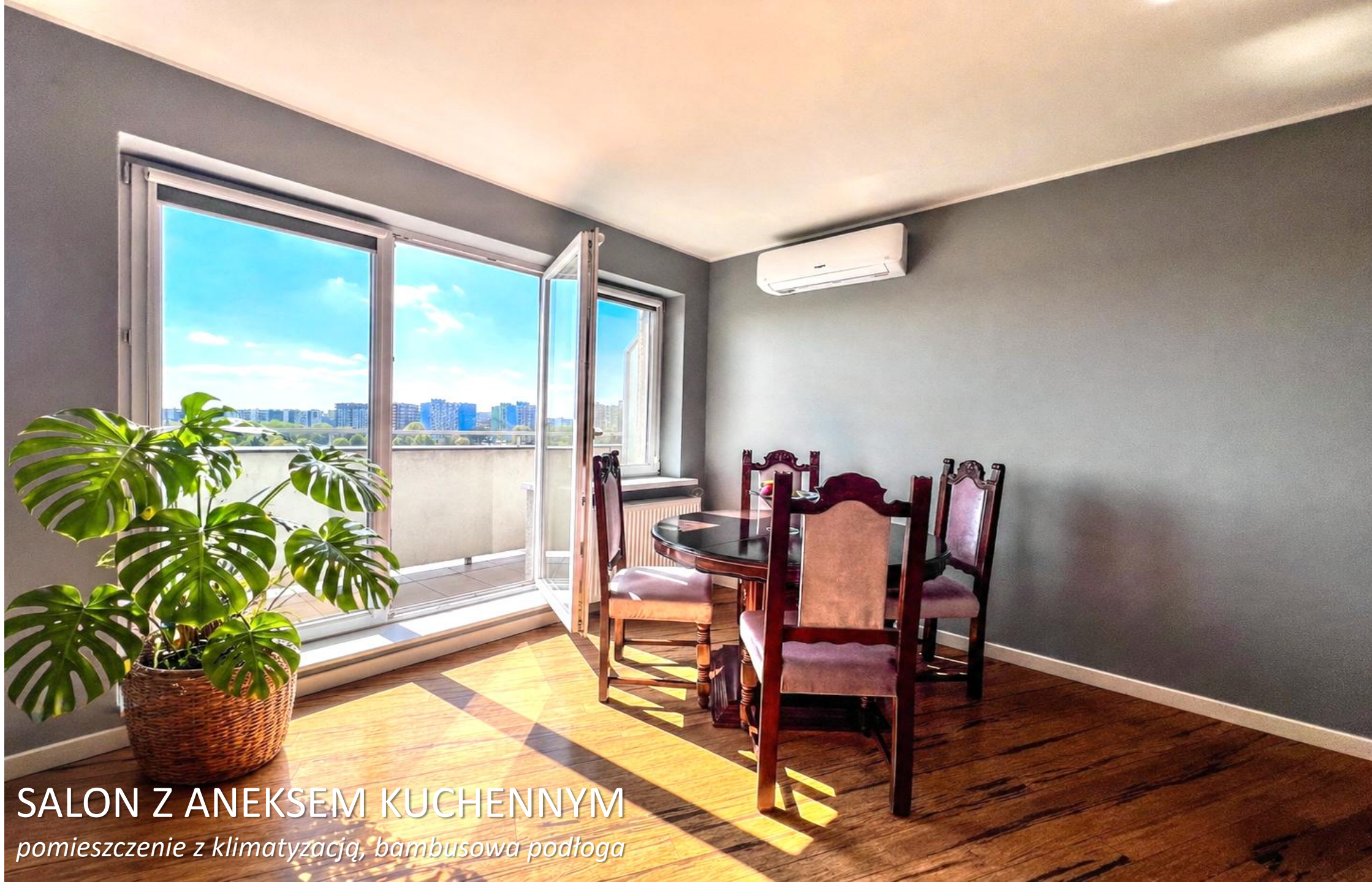
SALON Z ANEKSEM KUCHENNYM pomieszczenie z klimatyzacją, bambusowa podłoga