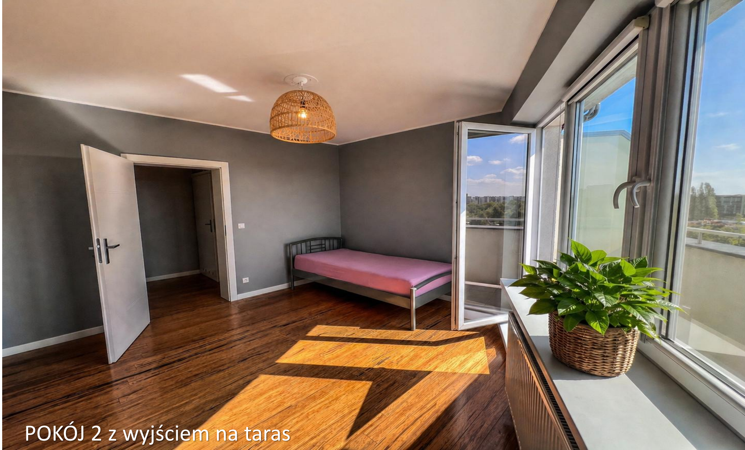
POKÓJ 2 z wyjściem na taras