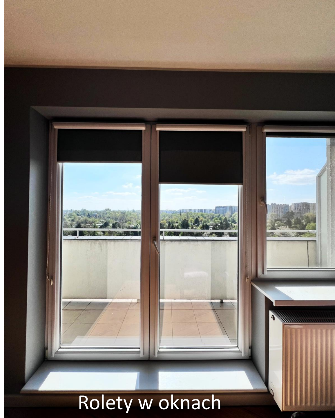
Rolety w oknach